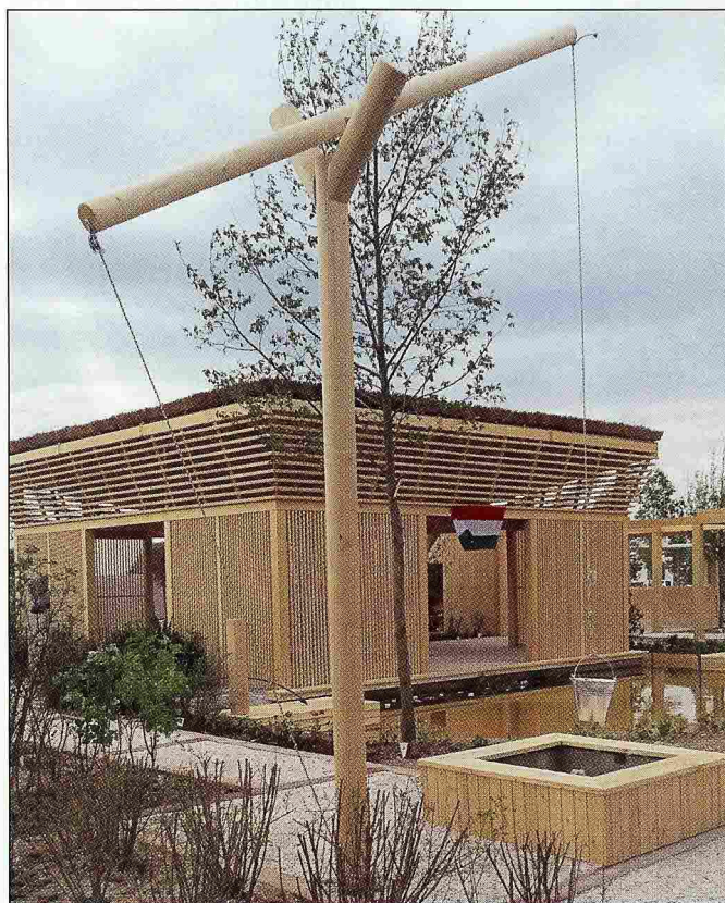
▲ A kertben helyet kapott egy gémeskút is, amelyet a gyerekek maguk is kipróbálhatnak. Az onnan kiemelt víz csatorna rendszeren keresztül a dísztóba folyik