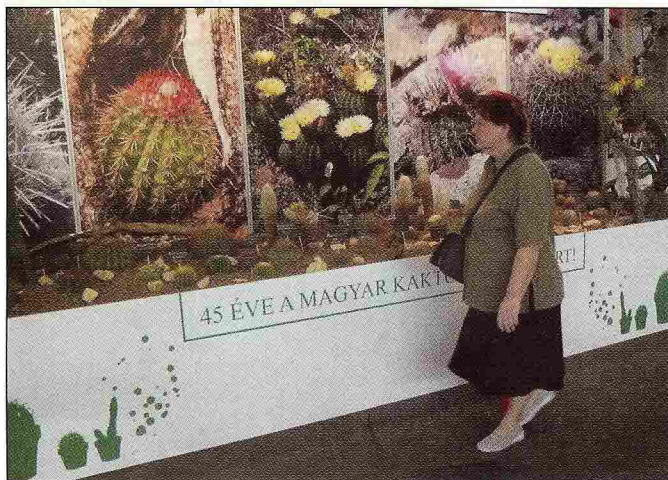
▲ Színvonalas kiállítással mutatkozott be a Magyar Kaktuszgyűjtők Országos Egyesülete